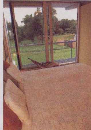
Grote glasvlakken garanderen een nauw contact met de tuin.