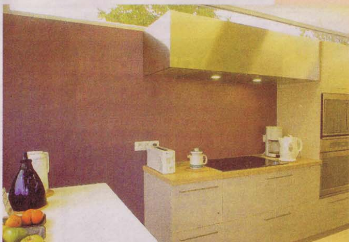
Het hoge bandraam brengt ook in de keuken, aan de straatkant, licht naar binnen.