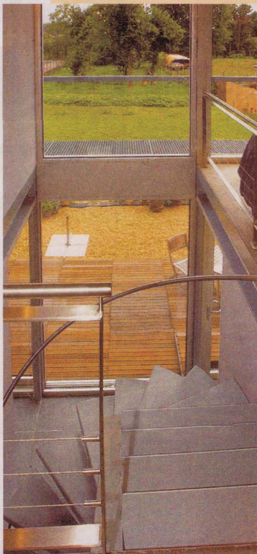
Bij een keuze voor staalbouw mag dat op sommige plekken ook duidelijk zijn.

Het opendeurweekend Mijn Huis, Mijn Architect vindt plaats op 23 en 24 september. De woningen zijn gratis te bezoeken van 14 tot 18 uur. Een overzicht van te bezoeken woningen vindt u op www.mijnhuismijnarchitect.be en in de catalogus, te koop in de dagbladhandel en bij Delhaize (6 euro).